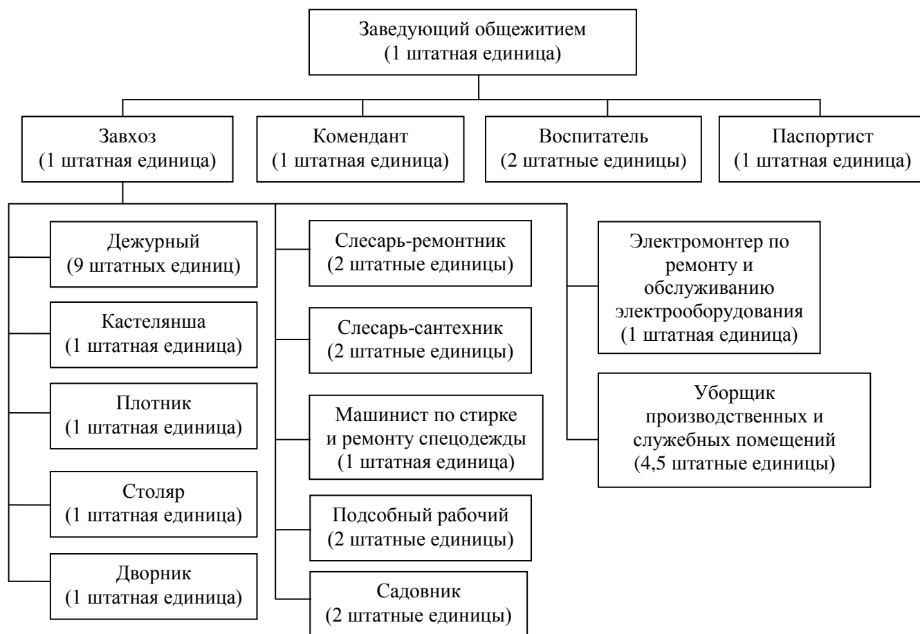
Рисунок 1. Организационная структура студгородка

Структура студгородка представлена на рисунке 1.