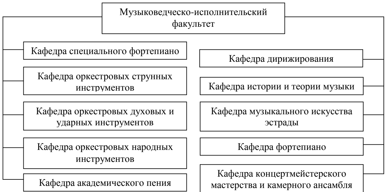
Рисунок 1. Организационная структура музыковедческо-исполнительского факультета

Структура музыковедческо-исполнительского факультета представлена на рисунке 1.