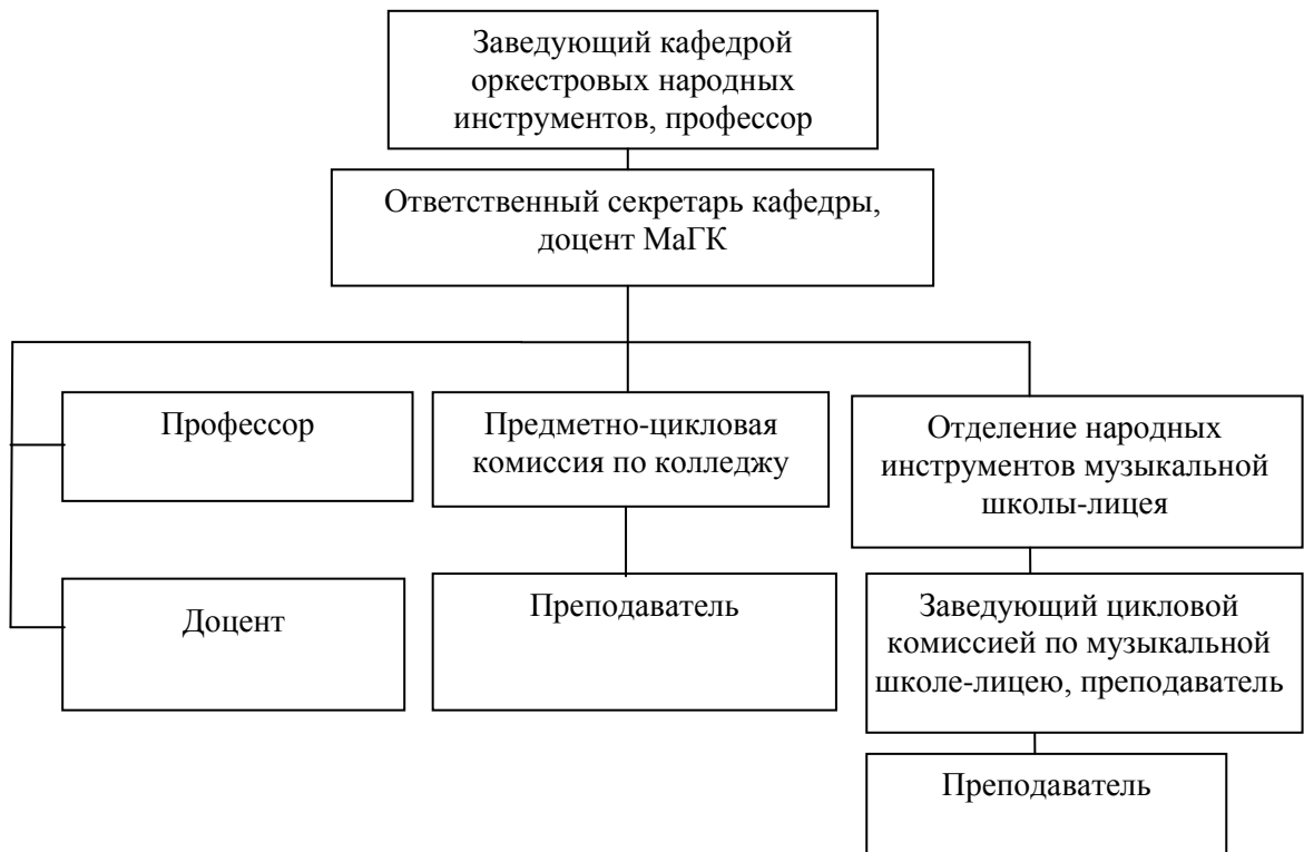
Рисунок 1. Организационная структура кафедры оркестровых народных инструментов

Структура кафедры оркестровых народных инструментов представлена на рисунке 1.