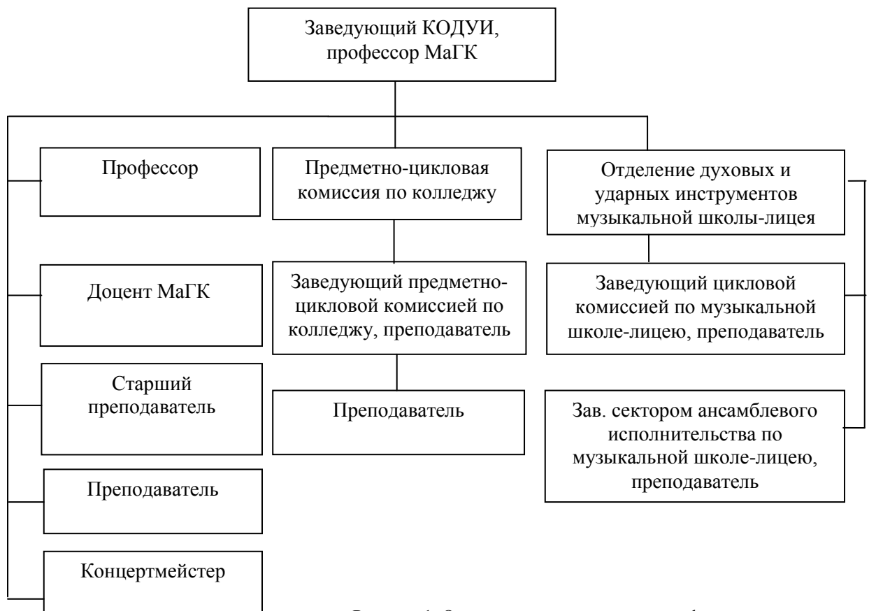
Рисунок 1. Организационная структура кафедры оркестровых духовых и ударных инструментов

Структура кафедры оркестровых духовых и ударных инструментов представлена на рисунке 1.