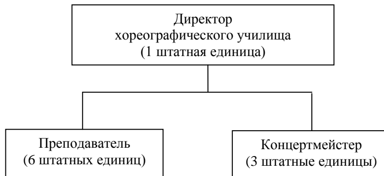
Рисунок 1. Организационная структура хореографического училища

Структура хореографического училища представлена на рисунке 1.